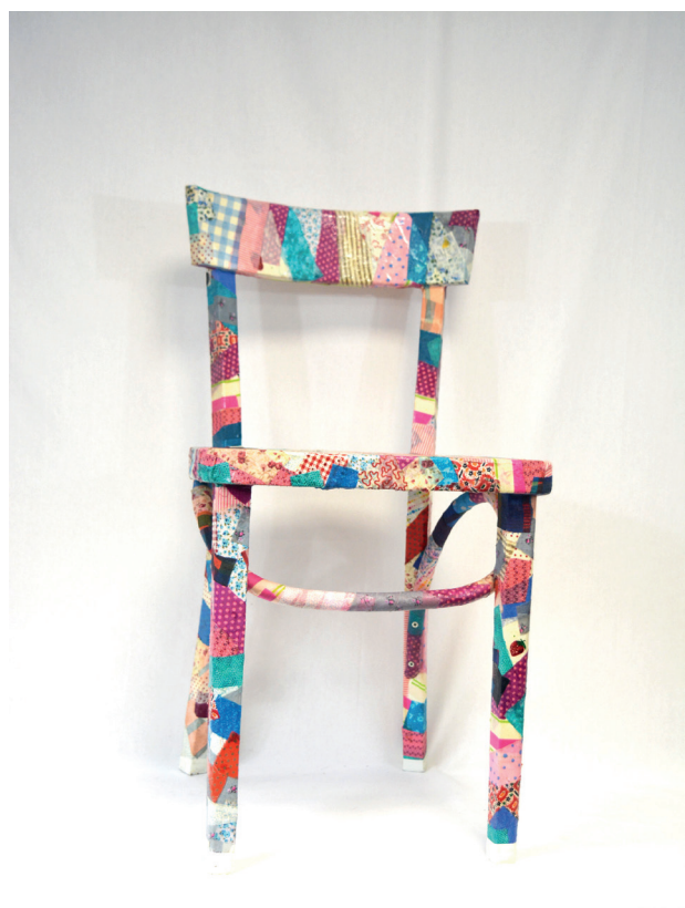
Chaise de l'atelier MIET www.emmaus31.org