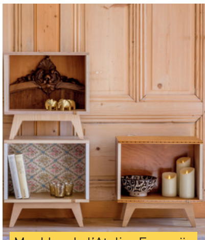
Meubles de l'Atelier Emmaüs https://atelier-emmaus.org/