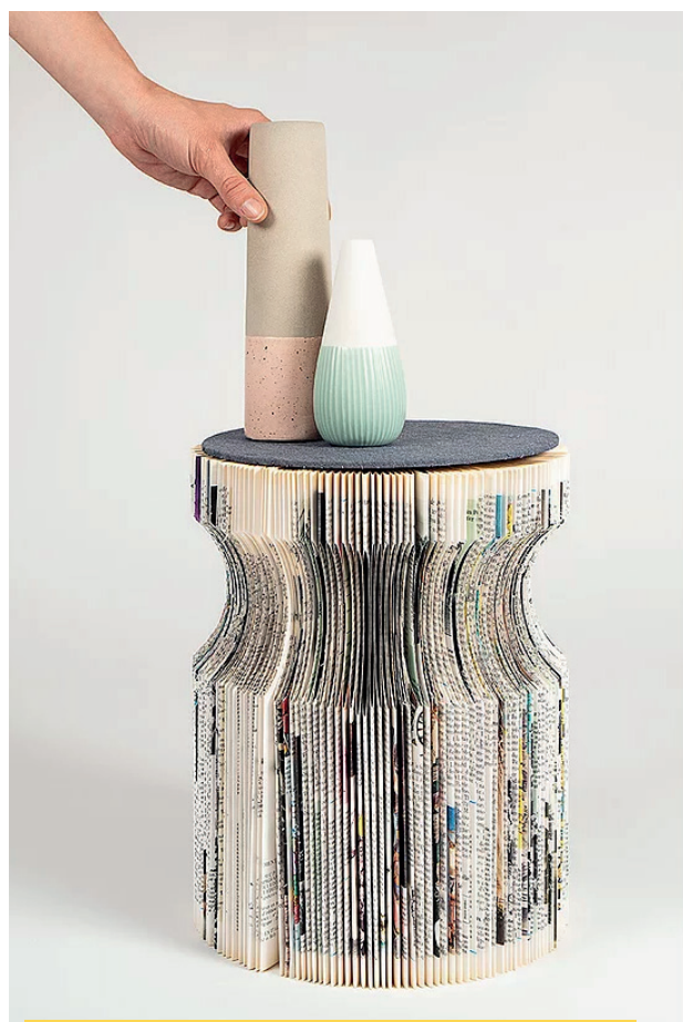
Table des Résilientes d'Emmaüs Alternatives www.les-resilientes.com