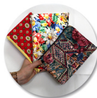
le labo de l'abbé

Cette vente sera l'occasion de montrer jusqu'où le savoir-faire emmaüssien peut aller, avec la présence des créations Mode du Labo de l'Abbé et la customisation par les street artists des petits meubles de L'Atelier Emmaüs , mêlant Design, Récup' et Insertion sociale.